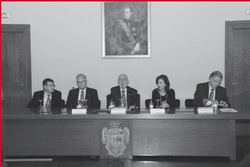
Mesa presidencial de la sesión inaugural del Curso Académico 2011-2012.