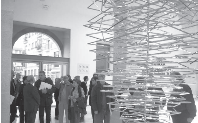
Los académicos de San Carlos en visita girada a la Institución CAMON de Alta Tecnología; y al Museo de Arte Contemporáneo de Alicante (MACA). (Fotos: José Huguet).