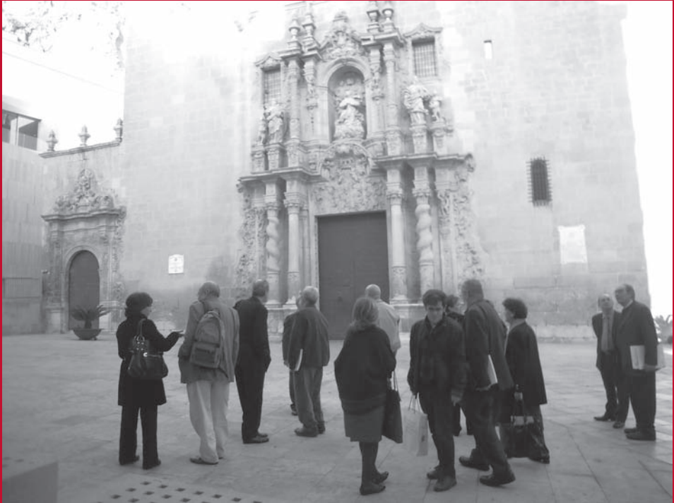
El cuerpo académico en su visita a la iglesia de Santa María de Alicante. (Foto: José Huguet).