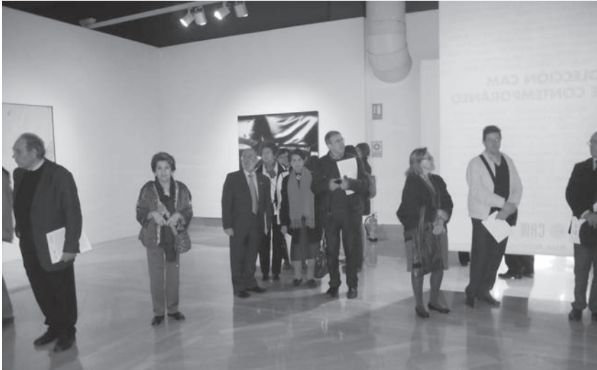
Los miembros de la Academia de Bellas Artes en su visita corporativa, el día 25 de noviembre de 2012, a la Colección CAM de Arte Contemporáneo celebrada en la Lonja del Pescado de Alicante. (Fotos: José Huguet).