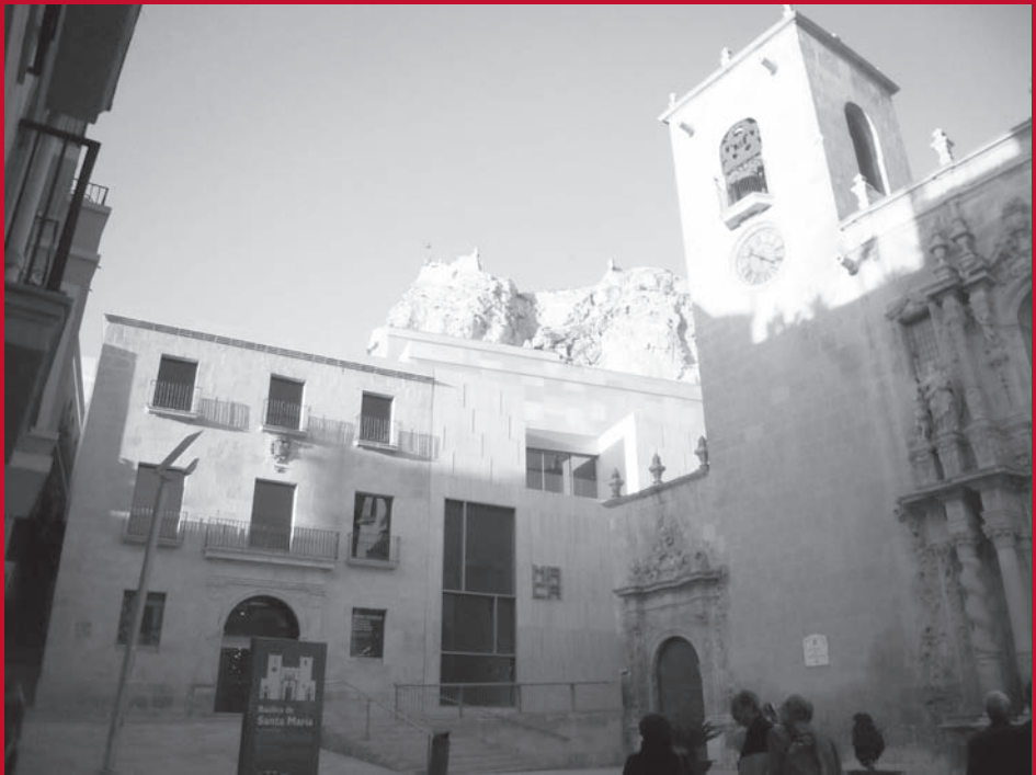
Museo de Arte Contemporáneo de Alicante (MACA).